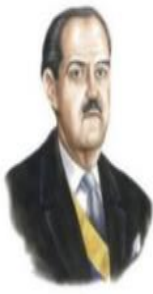
Guillermo León Valencia (1962-1966) Conservador